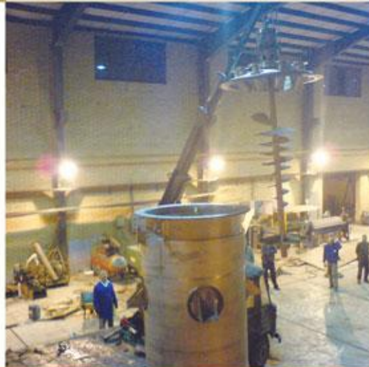
راکتور و میکسر تولید پودر شوینده