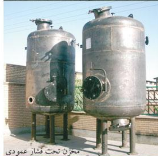
مخزن تحت فشار عمودی