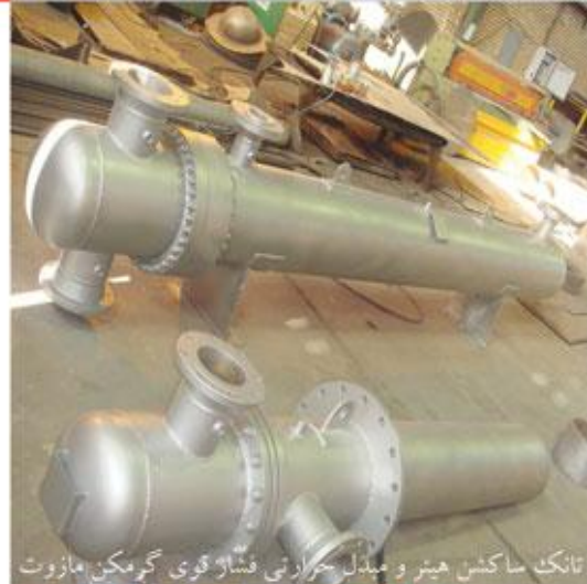
تانک ساکشن هیتر و مبدل حرارتی فشار قوی گرمکن مازوت