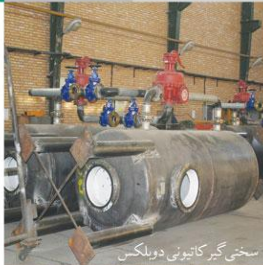
سختی گیر کاتیونی دوپلکس