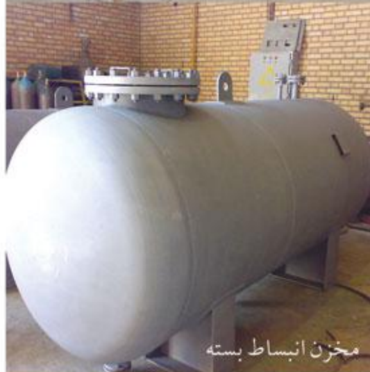
مخزن انبساط بسته