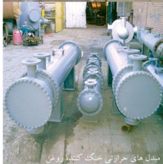
مبدل های حرارتی خنک کننده روغن