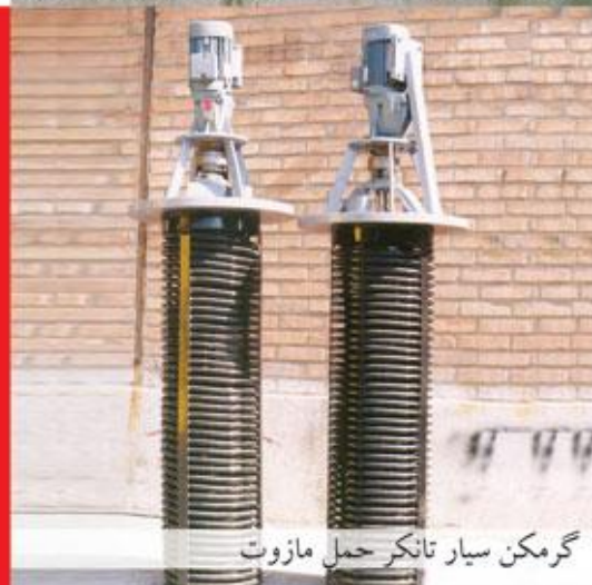
گرمکن سیار تانکر حمل مازوت