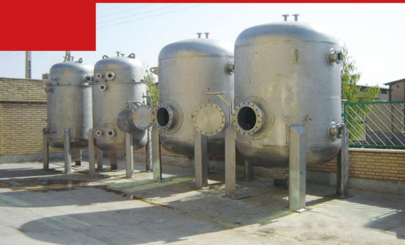
مخازن استنلس استیل