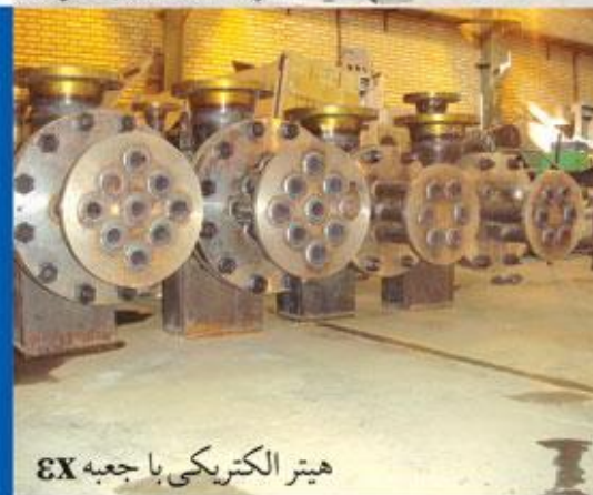
هیتر الکتریکی با جعبه EX