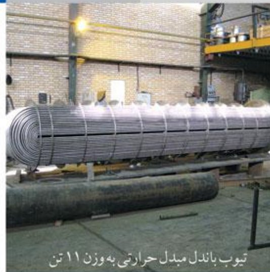
تیوب باندل مبدل حرارتی به وزن ۱۱ تن